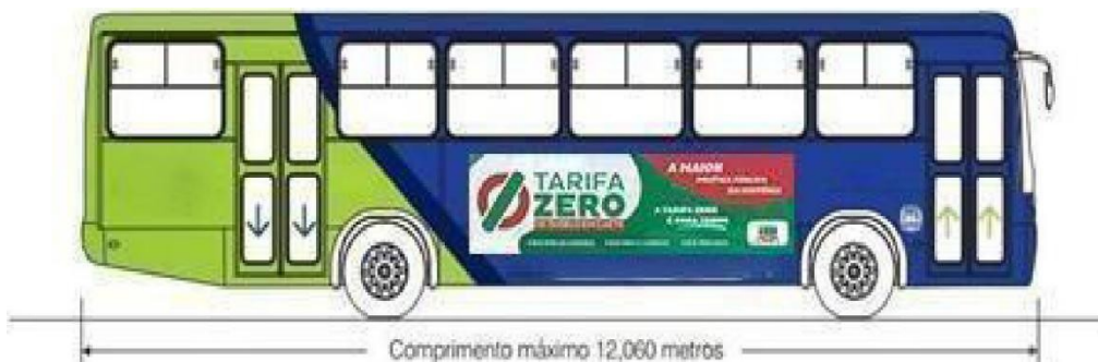
Comprimento máximo 12,060 metros