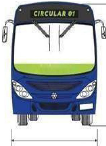
Largura máxima permitida 2,10m