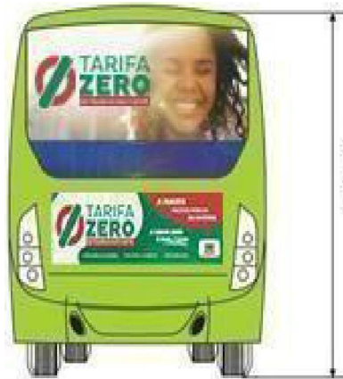
altura máxima 2,50m